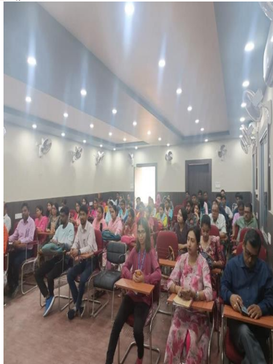
Figure 9 Seminar participation & document

Head of the department Department of Bengali