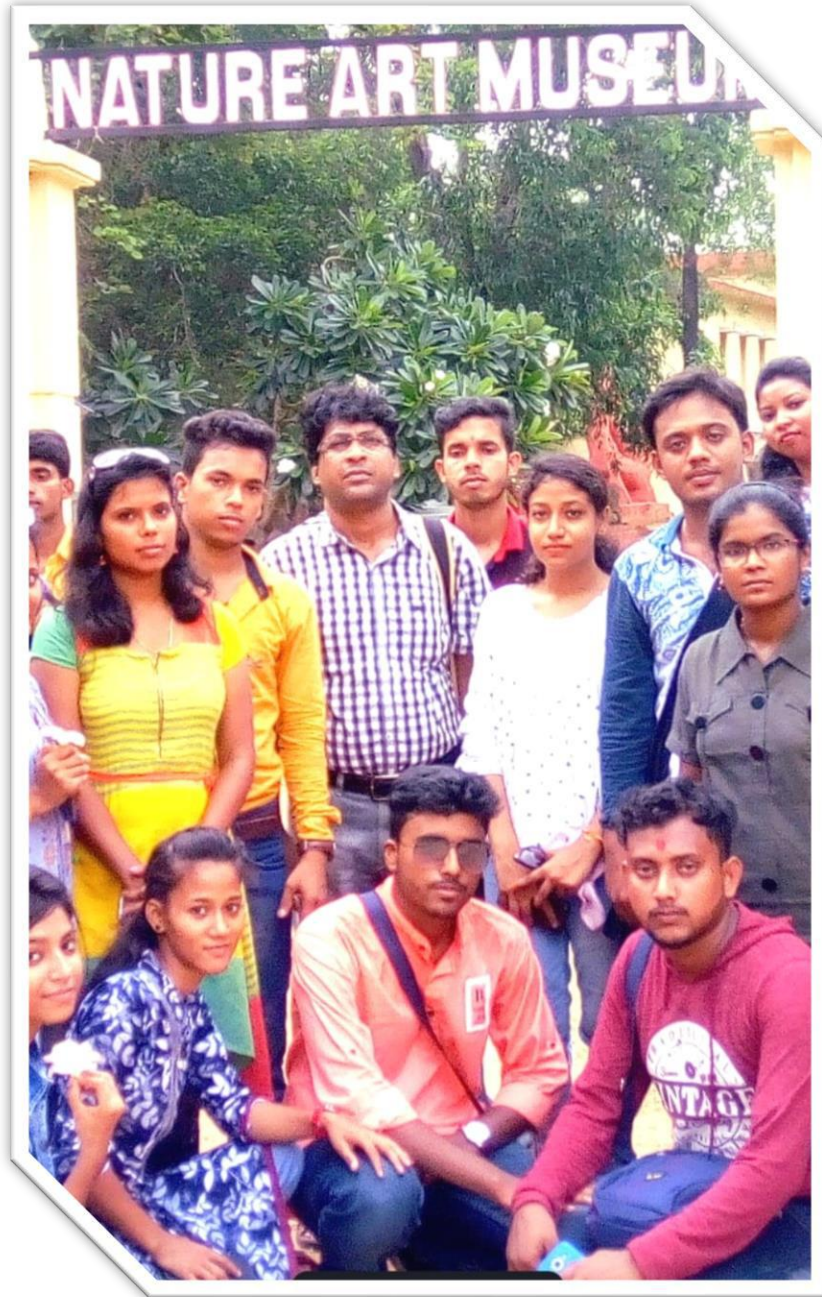
Figure 7 Student are on a Educational tour (Santiniketan Prakriti bhaban)