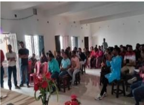
Figure 11 Student attendance & photo of the seminar