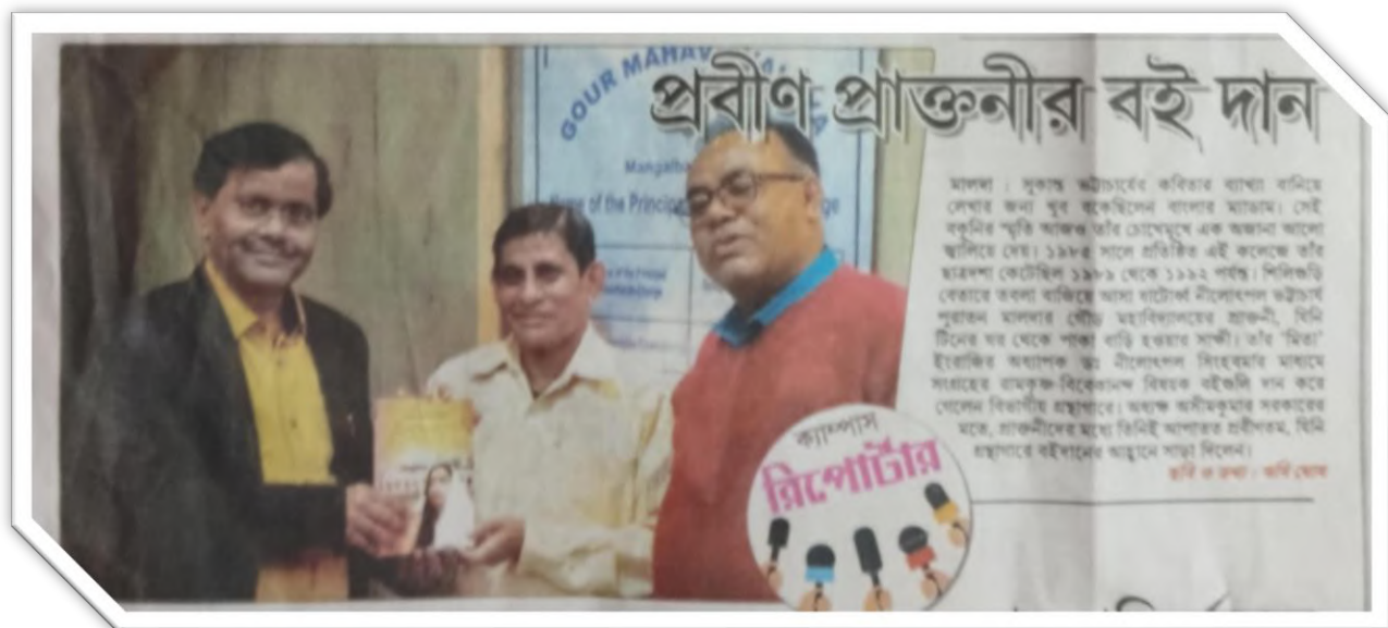
Figure 5 Alumni, Department of Bengali, donating book for departmental library ( Session 20-18-2019)